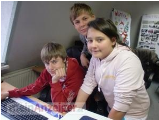
Zeiteinspringer bei der Arbeit

von Ingo Heidenreich aus Artern | vor 17 Stunden, 4 Minuten | 18 mal gelesen | 0 Kommentare | 0 Bildkommentare | 8 Bilder